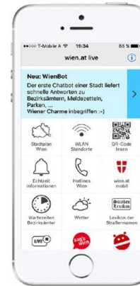
Stadt Wien App Push-Benachrichtigungen